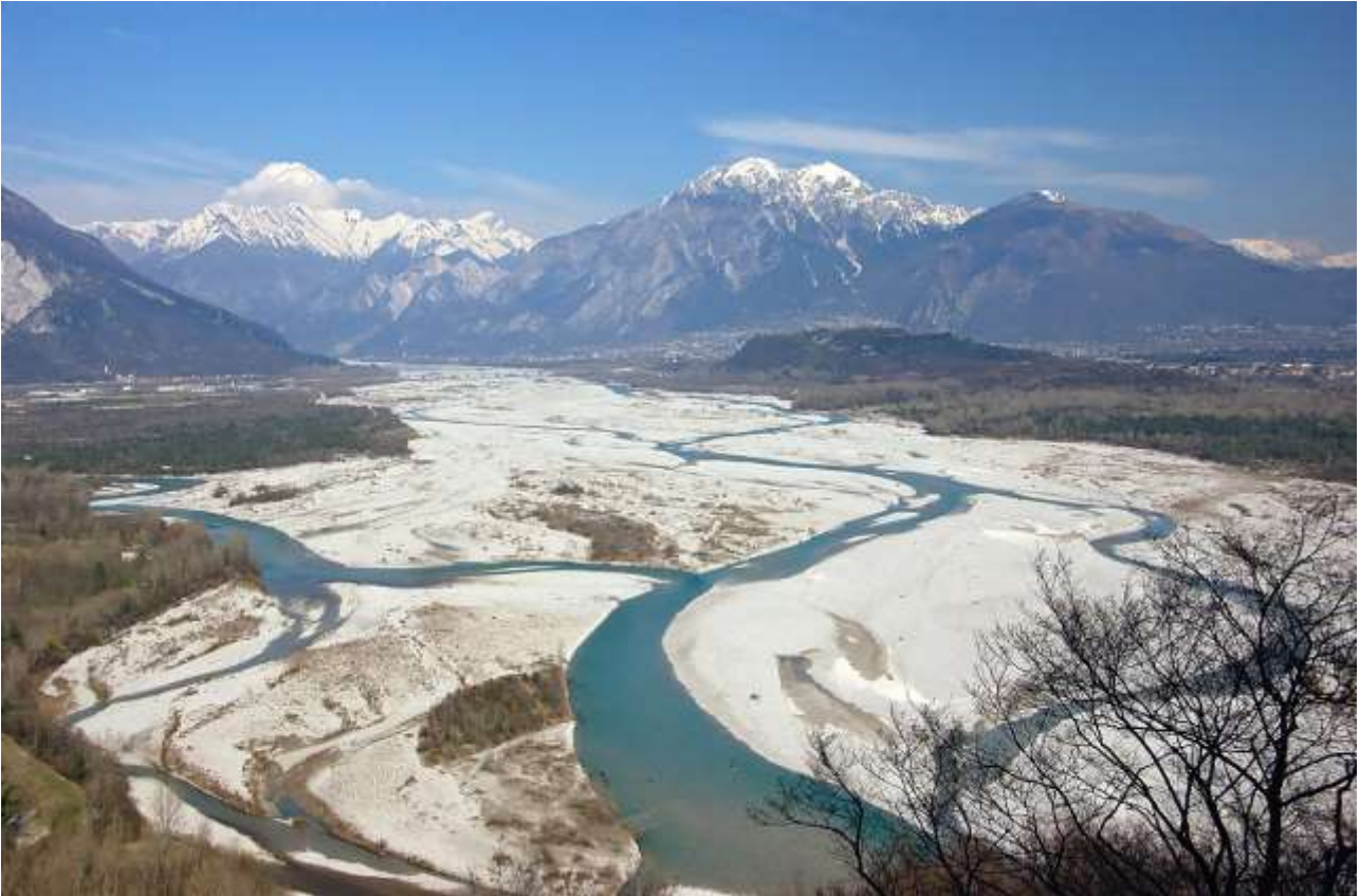
Il Tagliamento dal Friuli Occidentale, con in primo piano il colle di Osoppo, di origine morenica.

Il Fiume Tagliamento è Re dei Fiumi Alpini: è eccezionale la larghezza del suo alveo in greto a filoni liberi.