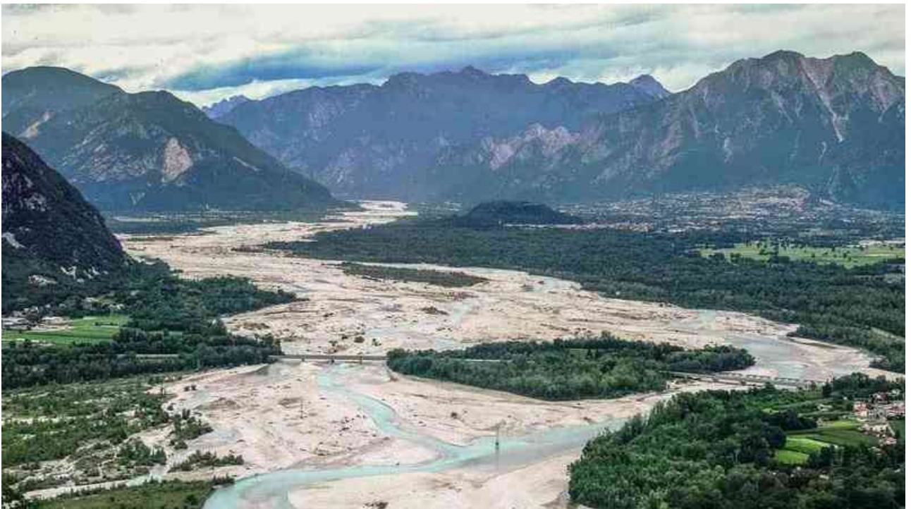
Il Fiume Tagliamento al Ponte Ferroviario di Cornino; sullo sfondo a destra il conoide di Gemona del Friuli.

Riserva Naturale Regionale LAGO DI CORNINO: http://www.riservacornino.it/