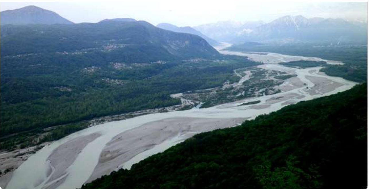
Dal Monte di Ragogna, verso nord: il Fiume Tagliamento nel primo tratto dell'Anfiteatro Morenico del Friuli.

Il Tagliamento dal drone: https://www.youtube.com/watch?v=E6nei1li6-A