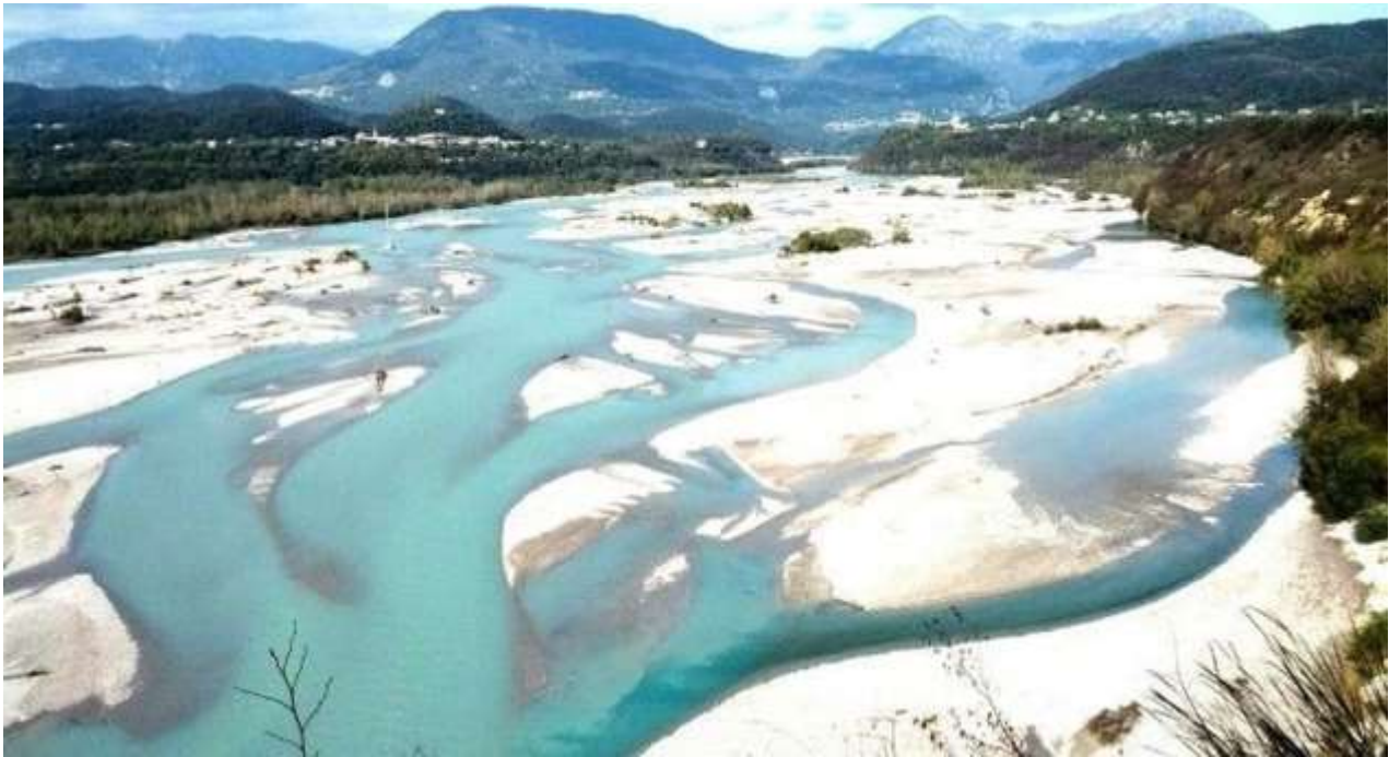
Il Fiume Tagliamento alla Stretta (al centro) di Pinzano (a sinistra); a destra Ragogna e l'omonimo Monte.

Il Tagliamento al Ponte di Pinzano: https://www.youtube.com/watch?v=AeuB4m9yNuE