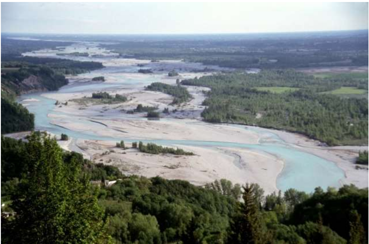
Dal Monte di Ragogna, verso sud: il Fiume Tagliamento solca l'Alta Pianura tra Friuli Centrale e Occidentale.

Il Tagliamento al Ponte di Pinzano: https://www.youtube.com/watch?v=AeuB4m9yNuE