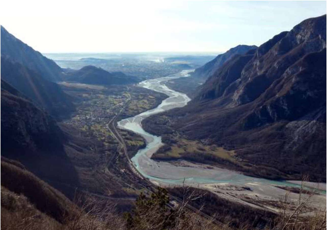
Da Monte Soreli, a Venzone (ex Provincia di Udine): il Fiume Tagliamento sbocca nella Pedemontana.