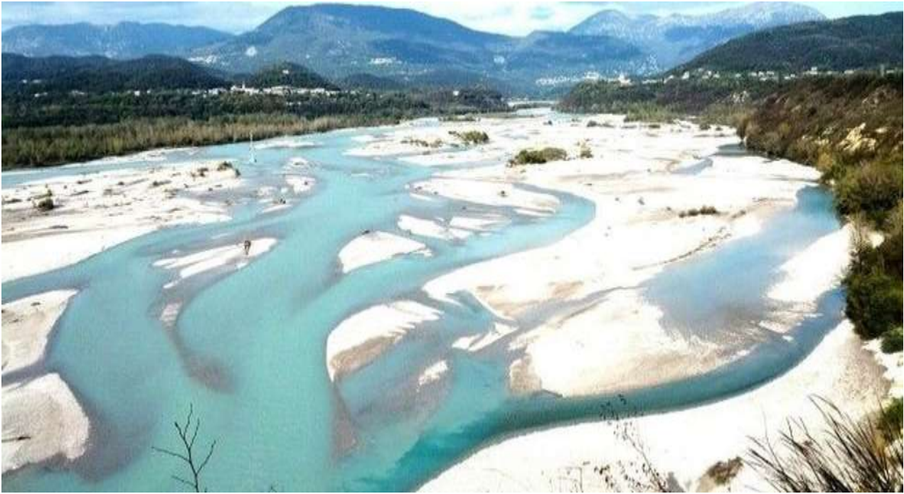
Il Fiume Tagliamento alla Stretta (al centro) di Pinzano (a sinistra); a destra Ragogna e l'omonimo Monte.

Il Tagliamento al Ponte di Pinzano: https://www.youtube.com/watch?v=AeuB4m9yNuE